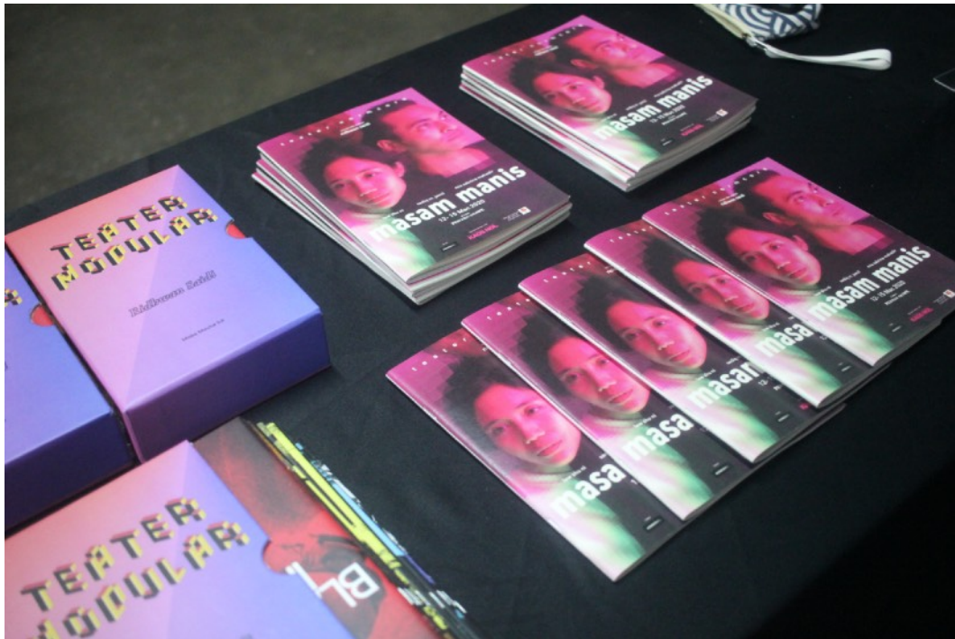
Teater Modular Box Set dan zine skrip Teater Normcore: Masam Manis turut dijual.

Selain pengalaman teater, kami turut cetak zine skrip untuk dibeli dan dibaca audiens. Ini sedikit sebanyak dapat mendedahkan proses bagaimana dari teks ia berubah bentuk menjadi performance .