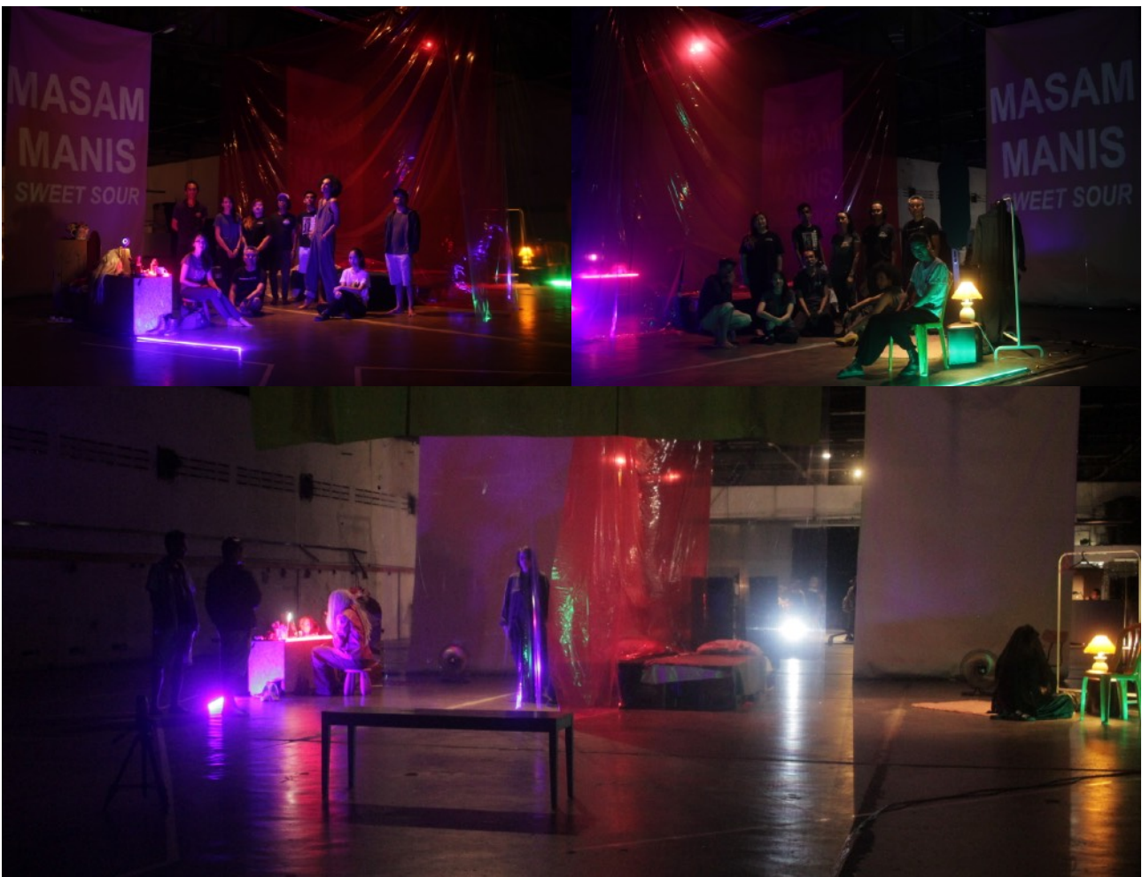
Bilik kiri, bilik kanan dan perspektif dari ruang hadapan.

Set yang terdiri dari dua bilik ini, membolehkan audiens mengalami dua pengalaman teater yang berbeza. Yang pertama mereka boleh pilih untuk duduk di kawasan tengah, dan perhatikan kedua-dua bilik. Situasi ini membolehkan mereka menyaksikan teater secara makro. Pilihan kedua pula, audiens boleh pilih untuk commit dengan salah satu bilik, lebih intim dan dekat, yang mana perasaannya lebih mendekati melihat pameran di galeri. Audiens boleh pilih untuk mendekati bilik watak Mar di belah kiri, atau bilik watak Hanim di belah kanan. Audiens juga boleh ubah posisi mereka bergerak secara aktif dari bilik ke bilik untuk merasa perspektif berbeza.