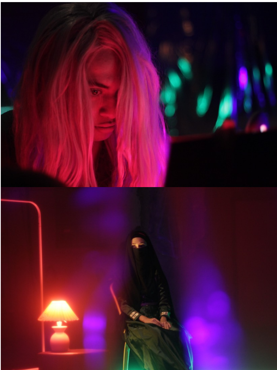
Foto sewaktu pementasan.

Penggunaan objek seharian seperti kertas dan plastik juga memantul dan membiaskan cahaya. Oleh kerana ruang ini tiada lampu istimewa, yang ada cuma lampu-lampu asas yang dikawal pada suis dinding, rekaan set secara tidak langsung memberikan lapisan-lapisan visual yang indah. Ada lapisan solid , transparent , dan translucent . Perspektif berubah untuk setiap posisi yang dipilih. Melihat secara berdiri berbeza pengalamannya berbanding melihat secara duduk di kerusi, dan duduk di kerusi berbeza dengan duduk di atas lantai. Jarak juga main peranan. Teater adalah pengalaman langsung yang amat peribadi. Tidak seperti teater proscenium di mana audiens melihat susunan imej dari jauh. Teater Normcore: Masam Manis menawarkan audiens untuk zoom in dan zoom out, untuk immerge ke dalam kisah di dalam bilik atau menjarakkan diri untuk perhati dari jauh. Setiap pengalaman unik untuk diri masing-masing.