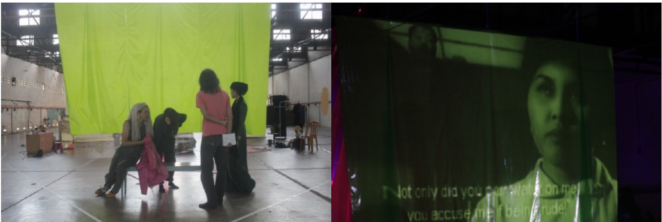
Plastik hijau yang akan dipancarkan sari kata dan petikan visual dari filem MASAM-MASAM MANIS

ringan dan boleh digulung untuk disimpan. Sampah diminimalkan dalam menuju ke arah produksi teater zero waste .